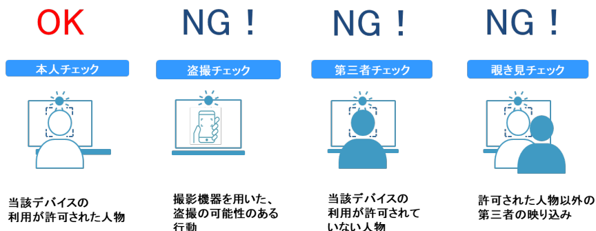
図 2: 利用イメージ